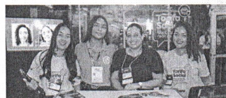
Promotoras do stand da Equatorial receberam o público participante, fizeram dúvidas e cadastraram na Tarifa Social