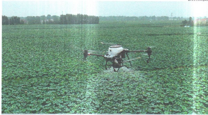
DJI T40 Gohobby, drone de pulverização e fertilização, que terá demonstração na Expo Indústria 2023

“As indústrias que têm alguma vinculação com o agronegócio exploram o setor primário. Um exemplo é a indústria de bebidas. O setor primário explora a cultura da cana de açúcar. Estarmos na Expo é um caminho para ampliarmos cada vez mais o parque industrial do estado. Eventos como a Expo beneficiam tanto a indústria