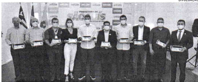
Solenidade na qual foi assinado o Termo de Cooperação entre o Município e a iniciativa privada

Assinaram o termo de cooperação com a Prefeitura, a Ordem dos Advogados do Brasil Seccional Maranhão (OAB-MA), o Sindicato das Indústrias da Construção Civil do Maranhão (Sinduscon-MA), a Câmara de Dirigentes Lojistas de São Luís (CDL), a Equatorial Maranhão, o Consórcio de Alumínio do Maranhão (Alumar) e a Federação do Comércio de Bens, Serviços e Turismo do Estado do Maranhão (Fecomércio-MA). Por meio da parceria, serão disponibilizados pelo