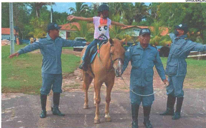
Serviço de equoterapia da Polícia Militar voltou a ser oferecido à população maranhense

Neste retorno das atividades, é trabalhado a readaptação