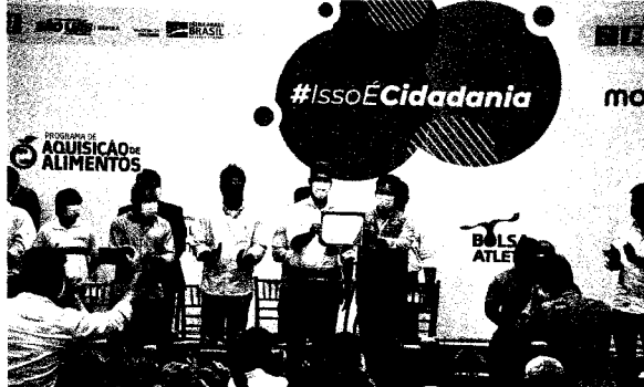
Ministro da Cidadania, João Roma, esteve em São Luís para reforçar o Programa de Aquisição de Alimentos

De acordo com o ministro, foram contemplados 29 municípios do Maranhão, com entregas de tratores, barcos, furgões e criação de cisternas, para auxiliar os pequenos agricultores e reforçar o investimento do PAA. Ao todo, foram construídas 2.400 cisternas, reservatório de água para agricultores, no Maranhão