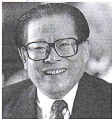
JIANG ZEMIN MORREU NA MADRUGADA DESTA QUARTA (30)

O ex-presidente chinês que liderou o país durante a transformação do final dos anos 1980 até o início do século XXI, faleceu nesta quarta-feira (30/11), aos 96 anos, anunciou a agência estatal de notícias Xinhua.