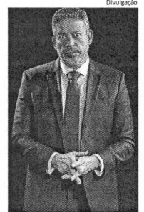
ARTHUR LIRA Presidente da Câmara dos Deputados